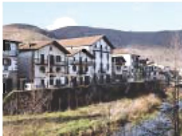
Casco urbano de Elizondo, en la ruta alternativa de Baztan.

Arizkun, Elizondo, Elbetea, Irurita y Berroeta-, un paraíso verde en el que no faltan los palacios de característicos sillares rojos. Antes de unirse en Arre con la ruta procedente de Orreaga/Roncesvalles, el camino sube y desciende el puerto de Belate.