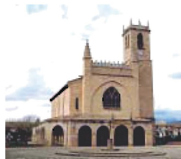
Iglesia junto a la que se representa el "Misterio de Obanos".

Muy conocida es también la historia de San Guillén y Santa Felicia, que se representa en el denominado "Misterio de Obanos". Felicia realizó el Camino de Santiago y a su vuelta renunció a sus privilegios como princesa de Aquitania y se quedó a servir en Amocáin (pueblo del Valle de Egüés). Su hermano Guillén, al no convencerla para regresar, le dio muerte y arrepentido peregrinó a Santiago y de regreso se recluyó en la ermita de Arnotegui.